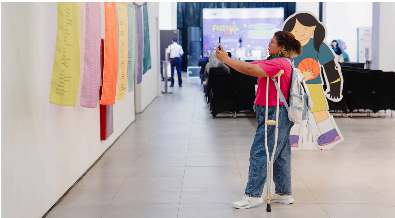
Keterangan: Salah satu narasumber perempuan disabilitas dalam acara Festival HAM 2025

Keresahan ini juga muncul dalam dokumen aspirasi orang muda pada Festival HAM (2025) yang menyoroti adanya kerentanan berlapis yang orang muda hadapi dalam pendidikan, kesehatan, dan pekerjaan. Persoalan akses pendidikan antar wilayah kota dan pedesaan menunjukkan ketimpangan yang nyata, termasuk kualitas pendidikan, baik tenaga pendidik maupun kurikulum, belum merata. Di sisi lain, kesehatan mental telah menjadi persoalan serius bagi generasi muda, akan tetapi ketersediaan layanan yang mengakui tantangan ini masih sangat terbatas dan belum sepenuhnya terjangkau. Dalam dunia kerja, praktik diskriminasi berbasis usia, gender, disabilitas, maupun latar belakang sosial juga masih menjadi hambatan sebagian orang muda untuk memperoleh pekerjaan yang layak.