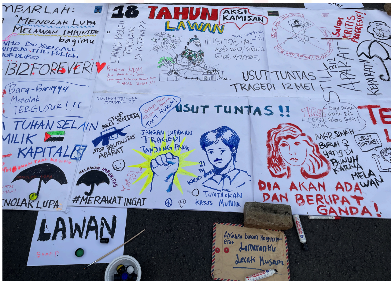
Keterangan: 18 Tahun Aksi Kamisan Indonesia

Ketika responden diminta menilai tingkat kepercayaan terhadap tindak lanjut laporan pelanggaran HAM, mayoritas responden (88,9%) menunjukkan skeptisme. Sebanyak 50,9% responden memberikan skor 1 dan 38% memberikan skor 2 yang menunjukkan ketidakpercayaan bahwa laporan pelanggaran HAM akan ditindaklanjuti. Sebaliknya, hanya 11,1% yang percaya (skor 3) bahwa laporan akan ditindaklanjuti secara adil, dan tidak ada yang memberikan skor 4 (sangat tidak percaya). Kutipan dari jawaban terbuka di atas menunjukkan bagaimana negara hingga sekarang masih belum menunjukkan keseriusan dalam penyelesaian kasus-kasus pelanggaran HAM berat masa lalu, sementara kasus-kasus lainnya seperti kekerasan seksual, terberatkan oleh persoalan birokrasi.