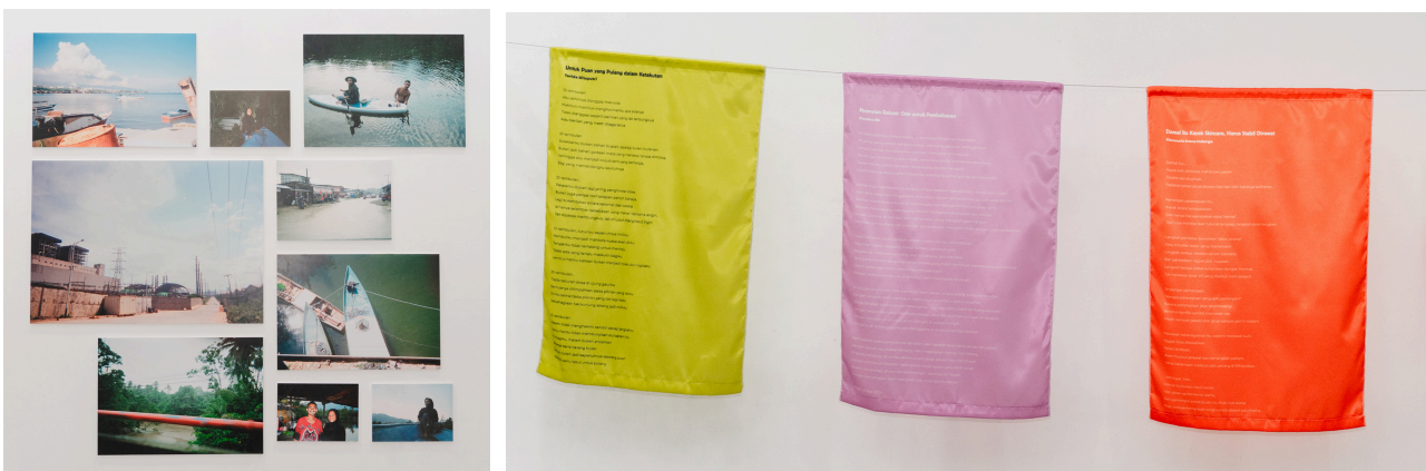
Keterangan: Contoh kebebasan berekspresi melalui karya seni yang ditampilkan dalam kegiatan Festival HAM 2025.

Ini sejalan dengan survei yang diselenggarakan oleh Yayasan Partisipasi Muda (2025). Orang muda melihat bahwa karakteristik utama pemerintahan saat ini adalah adanya adanya pembatasan terhadap kebebasan berpendapat atau kritik terhadap kebijakan pemerintah. Responden orang muda dengan pengalaman aktivisme melaporkan adanya penggunaan aparat keamanan untuk mengintimidasi atau membubarkan aksi damai, serta penggunaan instrumen hukum untuk menekan aktivis atau kelompok oposisi. Padahal, hak kebebasan berekspresi, menyampaikan pendapat, berkumpul dan berserikat merupakan elemen penting dari terciptanya ekosistem yang mendukung partisipasi orang muda secara bermakna.