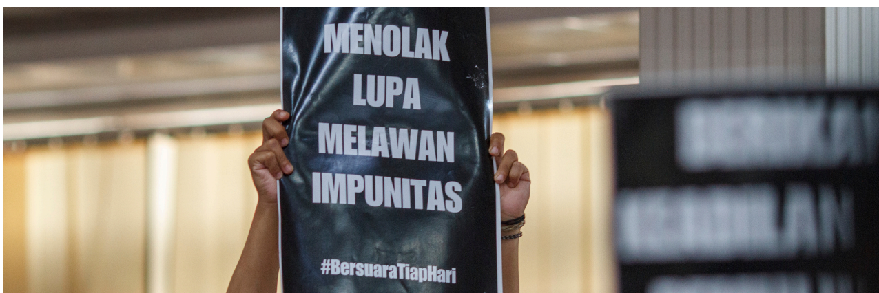
Keterangan: Foto poster tuntutan orang muda dalam kegiatan Festival HAM 2024

Melalui artikel ini, seri #CloseTheGap berupaya untuk menghadirkan suara orang muda melalui refleksi kritis kondisi HAM di Indonesia saat ini. Perspektif yang dimunculkan dalam mencoba untuk memahami tantangan yang dihadapi orang muda dan, disaat yang bersamaan, juga memastikan bahwa upaya pemajuan HAM benar-benar berangkat dari pengalaman hidup generasi yang akan menentukan arah gerak demokrasi Indonesia kedepannya, yaitu orang muda.