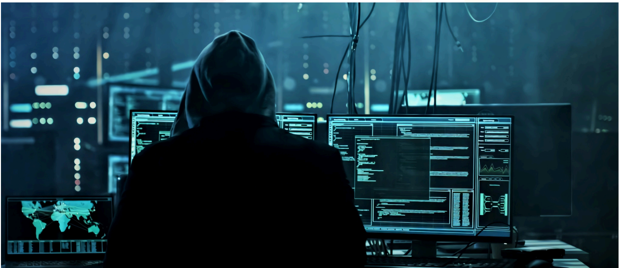
Keterangan: Ilustrasi serangan digital oleh hacker

Kekhawatiran tersebut juga tercermin dari dokumen INFID mengenai Penyampaian Aspirasi Kolektif Orang Muda dalam Pembangunan Inklusif (2025) yang menyoroti tantangan teknologi digital dan keamanan daring. Orang muda menyoroti risiko yang kerap mereka hadapi berupa pembatasan konten tanpa penjelasan yang transparan, misinformasi dan manipulasi narasi politik yang menyelimuti algoritma mereka, hingga praktik intimidasi digital seperti doxing dan penyalahgunaan AI ( Artificial Intelligence ). Tantangan lainnya adalah belum inklusifnya digitalisasi terhadap disabilitas, yang menyebabkan mereka semakin mengalami kerentanan. Aspirasi ini mempertegas bahwa akses teknologi harus dibarengi dengan adanya ekosistem digital yang aman, transparan, dan adil.