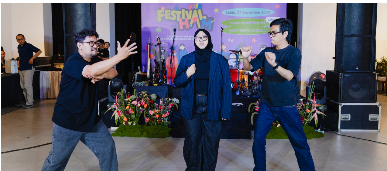
Keterangan: Penampilan Popjoy Sign dalam kegiatan Festival HAM 2025

Dari perspektif inklusivitas , jargon-jargon tersebut dipersepsikan belum mampu mewakili keberagaman pengalaman orang muda. Hanya 24,1% responden yang menyatakan jargon tersebut inklusif terhadap orang muda dari daerah, buruh muda, minoritas gender, disabilitas, atau kelompok marjinal. Selebihnya, hampir separuh responden (47,2%) menganggap jargon tersebut tidak inklusif , 0,9% menyatakan kurang inklusif, dan 27,8% menyatakan tidak tahu atau tidak yakin. Temuan ini mengindikasikan bahwa narasi arus utama tentang orang muda cenderung merepresentasikan kelompok tertentu, sementara pengalaman kelompok rentan dan marjinal masih terpinggirkan.