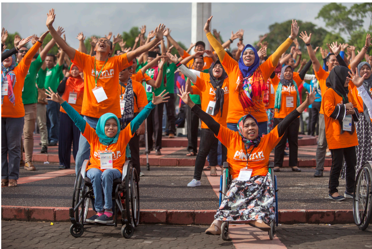
Keterangan: Acara PINTAR di Yogyakarta.

beban kerja perempuan. Krisis air, pangan dan kesehatan memaksa perempuan bekerja lebih keras untuk mempertahankan hidup keluarga. Kondisi tersebut menyebabkan waktu dan ruang perempuan untuk berorganisasi kian menyempit. Perempuan menanggung dampak pertama dari hilangnya ruang hidup, tetapi juga suaranya disingkirkan.