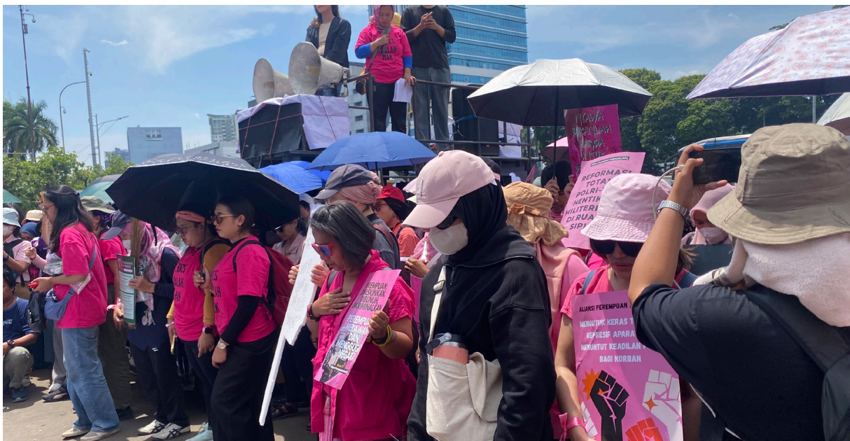
Keterangan: Aksi Protes Aliansi Perempuan Indonesia, September 2025.

Ketiga , memastikan peninjauan ulang kebijakan terkait pasal-pasal yang bersifat multitafsir agar tidak disalahgunakan untuk membatasi ruang sipil. Misalnya, sejumlah pasal dalam KUHP seperti yang mengatur tentang penghasutan, penghinaan terhadap kepala negara bersifat multitafsir dan mengancam kebebasan berekspresi. UU ITE mengenai pasal pencemaran nama baik, ujaran kebencian dan penyebaran informasi yang seringkali digunakan untuk membungkam kritik terhadap pejabat publik dan institusi negara.