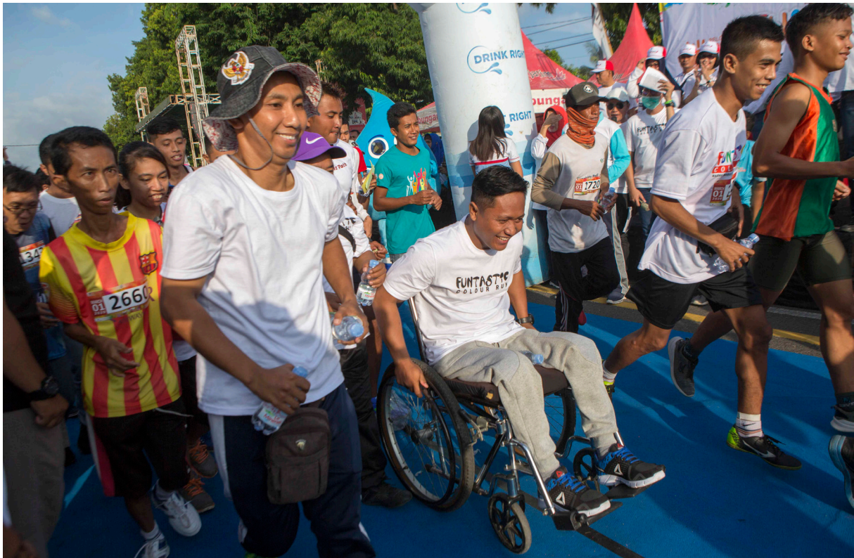
Keterangan: Acara lari maraton inklusi.